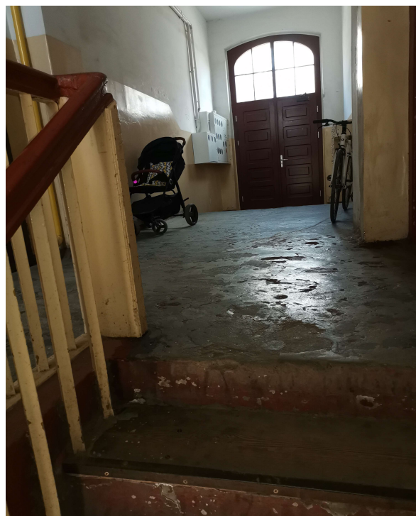
ZDJĘCIA KORYTARZY KLATEK SCHODOWYCH (DEMONTAŻ CZĘŚCI DESKOWANIA I MONTAŻ OKŁADZINY Z GRESU)