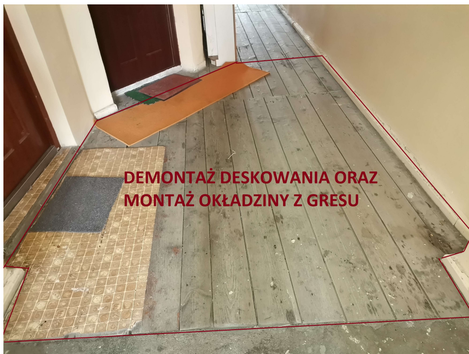
DEMONTAŻ DESKOWANIA ORAZ MONTAŻ OKŁADZINY Z GRESU